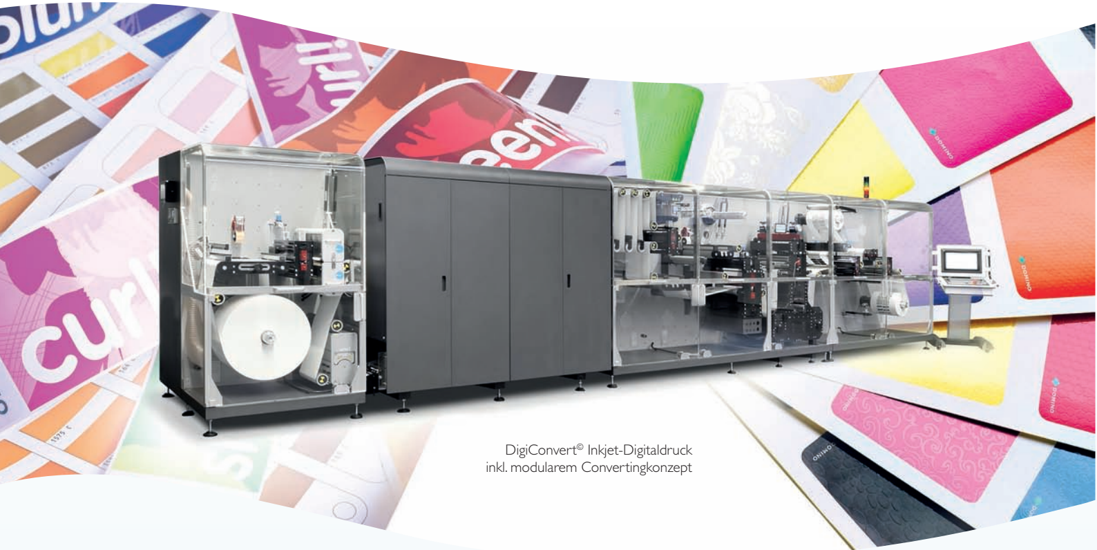
DigiConvert® Inkjet-Digitaldruck inkl. modularem Convertingkonzept

Domino & F+V Automation überzeugen durch Anlagenkonfiguration im Bereich Digitaldruck & Weiterverarbeitung